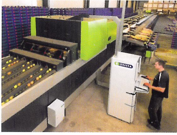
Afb. 2.82 Goed sorteren begint met het goed instellen van de machine.