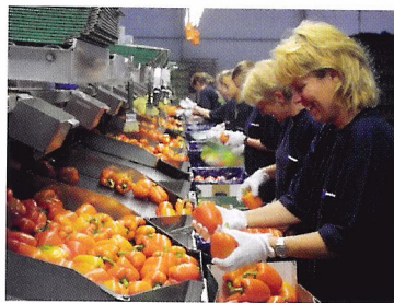
Afb. 2.86 Paprika's worden op maat, kleur en aantal gesorteerd en verpakt.