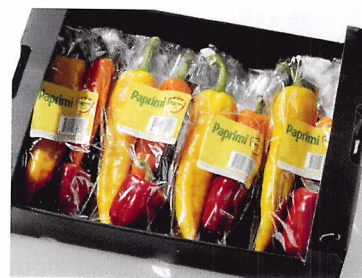
Afb. 2.87 Door producten te verpakken bescherm je ze tegen beschadigingen.