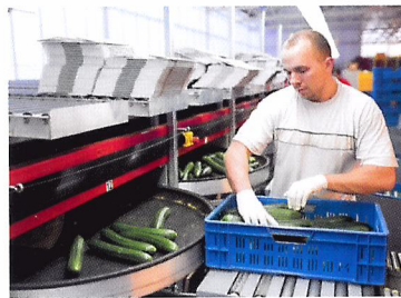
Afb. 2.77 Bij het sorteren legt de machine komkommers van hetzelfde formaat bij elkaar in een doos.