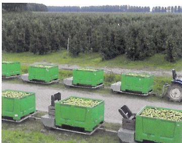
Afb. 2.79 Tijdens de oogst komen alle producten bij elkaar in kisten terecht.

Als je producten met de hand sorteert, gebruik je je ogen om te kiezen voor een product met de juiste kleur, rijpheid en grootte. Met je handen leg je de producten in de juiste doos. Bij een sorteermachine gaat dat natuurlijk anders. In de sorteermachine voor het sorteren van peren bijvoorbeeld, zitten camera's. Die maken een opname van elke peer. De computer vergelijkt deze opname met afbeeldingen van de peer in de gewenste kwaliteit. Daarbij let hij op kleur, afmeting, rijpheid en gezondheid. De geogste peer krijgt dan een code. De peren liggen op een lopende band. Een aflezer scant de code. De peer valt vervolgens in het juiste krat met peren van eenzelfde kwaliteit. Deze manier van sorteren gaat razendsnel en wordt ook gebruikt voor veel andere producten, zoals aardappelen en paprika's.