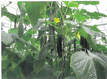
Afb. 2.76 Komkommers groeien in verschillende formaten aan de plant.

Grote komkommers, kleine komkommers, kromme komkommers. Ze groeien in allerlei formaten aan de plant. De komkommers in de supermarkt hebben allemaal hetzelfde formaat en liggen bij elkaar in een doos. Dat komt omdat de kweker na de oogst die komkommers bij elkaar gezocht heeft. Dat noem je sorteren. Sorteren kun je met de hand doen, maar dat kost veel tijd. Er zijn dan ook allerlei sorteermachines waarmee je producten kunt sorteren. Ze kunnen aardappelen, groentes, fruit en bloemen op kleur, vorm en afmeting sorteren.