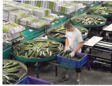
Afb. 2.83 Tijdens en aan het eind van het sorteerproces is er altijd een controle door mensen.