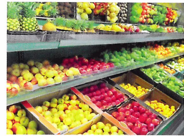
Afb. 2.84 Na het sorteren zitten producten van dezelfde rijpheid, kleur, vorm en afmeting bij elkaar in een verpakking.

2.30 Wat is het voordeel van het werken met een sorteermachine?