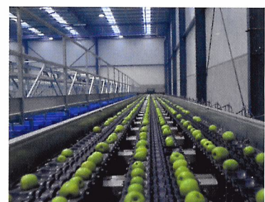
Afb. 2.81 Een lopende band vervoert het product per stuk. Daarna wordt elke appel in de juiste kist gelegd.