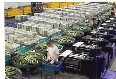
Afb. 2.78 Moderne machines zorgen dat de komkommers gesorteerd en geseald in dozen verpakt worden.