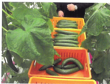
Afb. 2.85 Kromme komkommer worden gescheiden van de rechte. De consument wil graag rechte komkommers. De kweker krijgt er meer geld voor.