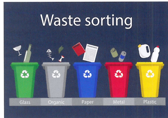
Afb. 2.75 Sorteren doen we allemaal! In de hele wereld wordt afval gesorteerd.

In Nederland worden er dagelijks miljoenen producten gesorteerd. Denk aan koffers op de luchthaven, postpakketten, levensmiddelen in de supermarkt, maar ook kleding en schoenen in de winkels en distributiecentra. Zo worden ook veel geogste producten gesorteerd voor ze het bedrijf verlaten.